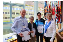
Preisübergabe an die Siegerevereine 2023