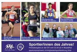
Tolle Vorbilder für die Jugend: unsere Sportlerinnen und Sportler des Jahres 2022.