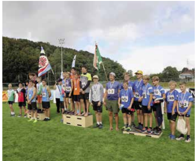
Unionsstaffette Knaben: 1. Ostschweiz, 2. FTSU, 3. Schwyz.