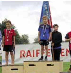
Knaben 8 Jahre