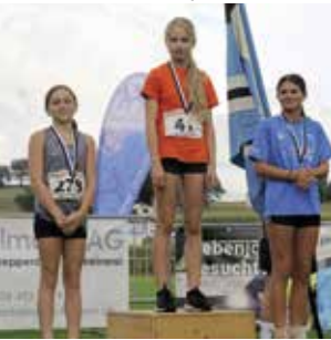
Einzelwettkampf M 12 Jahre