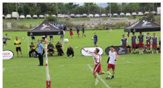
Das U21-Herren-Team im Einsatz in Jona.