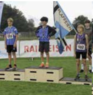
Einzelwettkampf K 12 Jahre