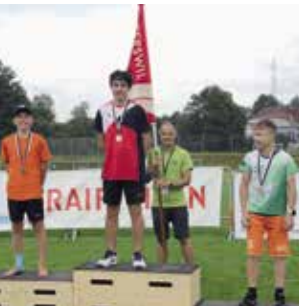
Knaben 13 Jahre