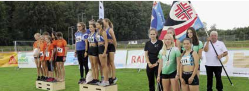
Gruppenwettkampf Mädchen 13-16 Jahre: 1. Andwil, 2. Wil, 3. FTSU.