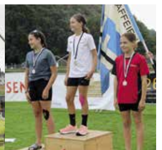
Mädchen 11 Jahre