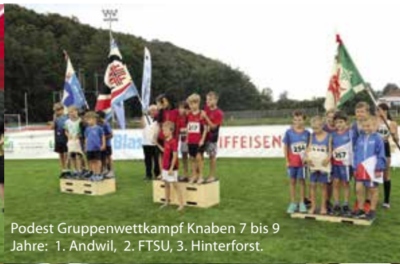
Podest Gruppenwettkampf Knaben 7 bis 9 Jahre: 1. Andwil, 2. FTSU, 3. Hinterforst.