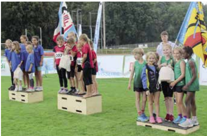
Gruppenwettkampf Mädchen 7-9 Jahre: 1. Andwil, 2. Wil, 3. FTSU.