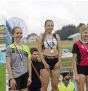
Mädchen 15 Jahre