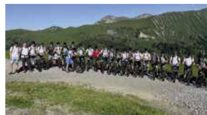
Den Weg vom Betelberg ins Tal hinunter legten die Laupersdorfer mit den Trotti-Bikes zurück.

27 Turner der Aktiv- und Männerriege bewegten sich auf sportlichen Pfaden durchs Berner Oberland. Mit einem Halt im Städtchen Gruyeres schlossen sie die wunderbare zweitägige Vereinsreise ab. WWW.KTVLAUPERSDORF.CH