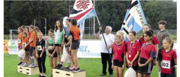
Gruppenwettkampf Mädchen 10-12: 1. FTSU, 2. Niederbüren, 3. Andwil.