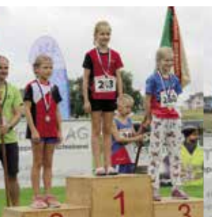
Mädchen 9 Jahre