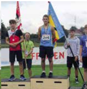
Knaben 14 Jahre