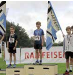
Knaben 10 Jahre