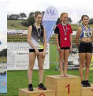
Mädchen 13 Jahre