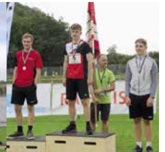
Knaben 16 Jahre