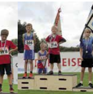
Knaben 9 Jahre