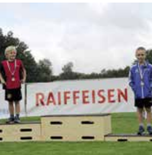
Einzelwettkampf K 7 Jahre