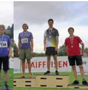
Knaben 15 Jahre