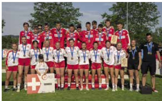
Die beiden U18-Nationalteams holten Bronze.

Beide U18-Teams Männer und Frauen kämpften an der Europameisterschaft in Münchwilen beherzt vor heimischem Publikum und holten zweimal Bronze. Schliesslich stand auch das Schweizer U21-Team der Männer europamässig im Einsatz. An der in das internationale Obersee Masters von Faustball Jona eingebetteten Europameisterschaft holten die U21-Männer ebenfalls die Bronzemedaille. bs