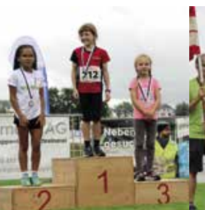
Mädchen 8 Jahre