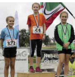
Mädchen 10 Jahre