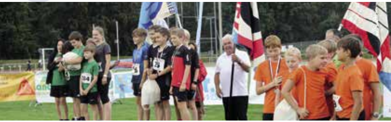
Gruppenwettkampf Knaben 10-12 Jahre: 1. FTSU, 2. Birmenstorf, 3. Niederbüren.