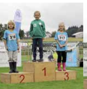
Einzelwettkampf M 7 Jahre