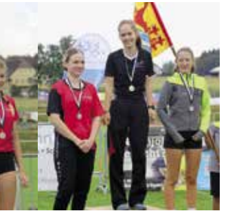
Mädchen 16 Jahre