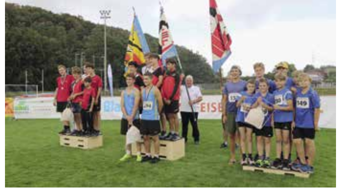
Gruppenwettkampf Knaben 13-16: 1. FTSU, 2. Andwil, 3. Altendorf.