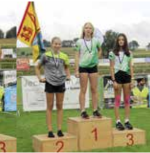
Mädchen 14 Jahre