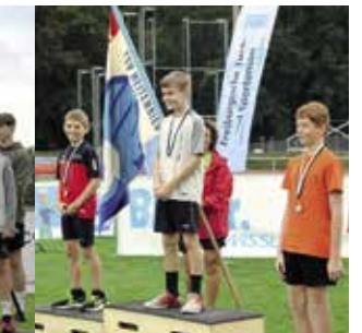
Knaben 11 Jahre