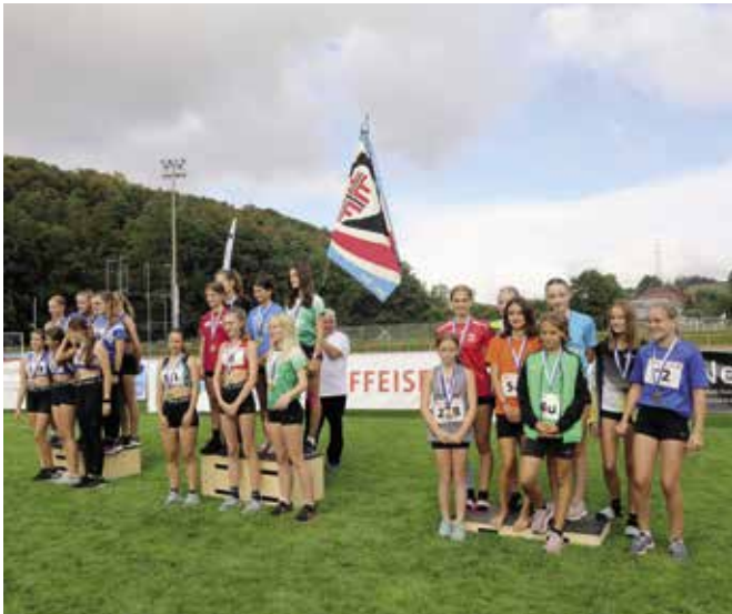
Unionsstaffette Mädchen: 1. FTSU, 2. Schwyz, 3. Ostschweiz.