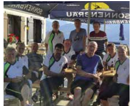
Die Männerriege des TV Rebstein beim Berggasthaus Palfries.