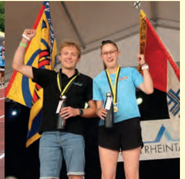
Sieger Wahlmehrkampf Kategorie 1.

und Teamwettkampf 30+ messen. Nebst dem grossen Festzelt luden kleine dezentrale Festwirtschaften zum gemütlichen Beisammensein ein. Während die einen bei Pendelstafette, Hindernislauf, Korbeinwurf usw. um Punkte und gegen die Hitze kämpften, haben 85 andere das Bewegungsfest bei einer geführten Wanderung zur Kristallhöhle Kobelwald genossen. Auch das war eine sportliche Leistung, auf die beim Apéro – spendiert von der Veteranenvereinigung der SUS – angestossen werden durfte. Intensiv gefeiert wurde dann bei der abendlichen Turnerparty, sei es mit dem Duo ChueLee, DJ Beatstyle oder den Hendermoos Buebe.