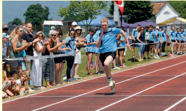
Sportfestsieger KTV Altstätten bei der Pendelstafette.

Das Sportfest startete am Freitagabend mit dem «Fyrobig-Cup», einem lockeren Plauschwettkampf für die lokalen Firmen und Vereine, und musikalischer Unterhaltung. Am Samstag konnten sich die Vereine auf den bestens vorbereiteten Wettkampfplätzen im Sektionswettkampf, Wahlmehrkampf