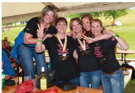
Der TuS Hägendorf feierte den Verbandsmeistertitel gebührend im Festzelt.

Bereits zum zehnten Mal trafen sich netzbballbegeisterte Frauen und Männer vom 19. bis 27. April in Giverola an der Costa Brava in Spanien zur Netzbball-Trainingswoche. Fast 40 Personen – es war lebendig, fröhlich... und sehr intensiv! Die Organisatorinnen freuen sich, wenn ihr euch den 17. bis 24. Mai 2014 für die nächste Netzbballwoche bereits reserviert!