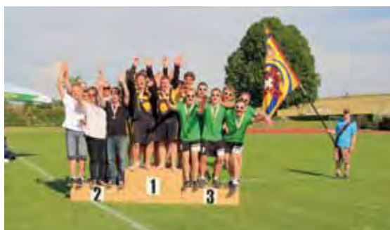
Siegerpodest Verbandsmeisterschaften 2013: Alle freuten sich wie Sieger.