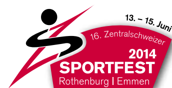
Sechstklässler aus Rothenburg eröffneten den Countdown mit einer Stafette über die alte Holzbrücke von Rothenburg nach Emmen.

16. Zentralschweizer Sportfest Rothenburg-Emmen 2014