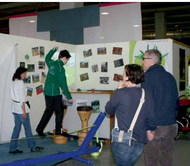
Slackline als Publikumsmagnet am Stand der Sport Union Ostschweiz.

Vom 10. bis 14. April zeigten sich etwa 20 Sportverbände an der Sonderausstellung «Sport» der IG St. Galler Sportverbände den OFFA-Besuchern. Bereits zum 13. Mal war auch die Sport Union Ostschweiz in der Halle 9.0 präsent. Mit der «Slackline» und Rock'n'Roll aus Andwil bewegte sie das Publikum.