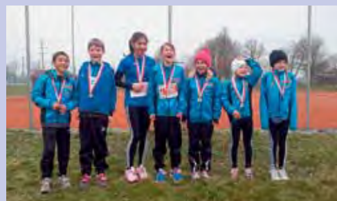
Trotz naschkaltem Start der Freiluftsaison: Die LAG (Leichtathletik Gossau) startete höchst erfolgreich.