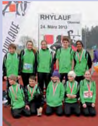
Reiche Medaillenausbeute für die Forti Athletics am Rhylauf Oberriet.