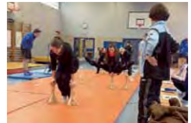
Die Teilnehmer an den Böckli, einer Trainingshilfe für die Partnerübungen.