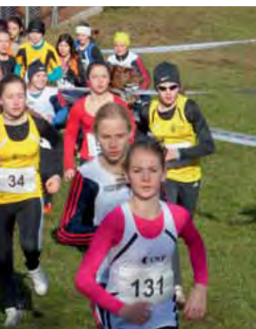
Bewegte Zentralschweizer Jugend am traditionellen Jugend-Cross-Cup, hier der 2. Lauf in Beckenried.

Der 2. Lauf wurde am 27. Januar in Beckenried durchgeführt. Tolles Wetter, motivierte Sportler und tatkräftige Publikumsunterstützung trugen zu einem gelungenen Tag bei.