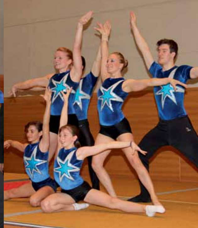
Sie hatten's voll im Griff: Zentralvorstand Sport Union Schweiz (oben), OK Schweizer Sportfest 2012 (unten), Showteam KTV Dietikon/Wintiakro.

dank ausserordentlicher Projektbeiträge möglich». Die Mitgliederzahl liegt bei 40'000, ein Drittel davon sind beitragsfreie Kinder und Jugendliche.