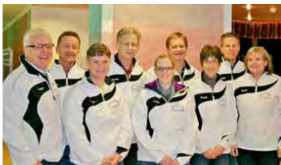
Das OK des kantonalen Jugitages freut sich auf euren Besuch in Steinen.