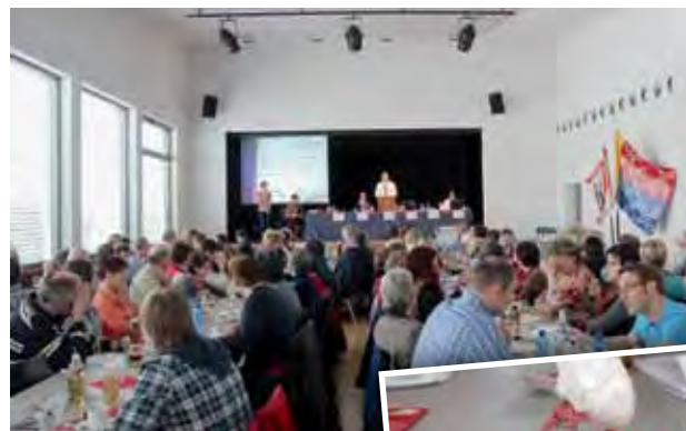
DV im sonnig dekorierten Gemeindefaal.

Die Sport Union Ennetbürgen war am 16. März aufmerksame Gastgeberin der 4. DV des Zentralschweizer Verbandes. Mit der DV 2013 war die Sport Union Zentralschweiz nun in all ihren vier Hauptkantonen einmal zu Gast. Sie konnte viele Gäste begrüßen und erfolgreiche Sportler ehren.