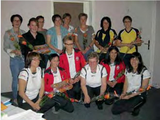
Netzball-Kantonalmeisterschaft 2. Liga: 1. Frasnacht, 2. Ernetschwil, 3. Oberriet Damen 2.

Am 11. Kantonalen Netzball-Leiterinnentreffen vom 24. April in Frasnacht wurden die besten Teams der Wintermeisterschaft 2012/13 geehrt. Dabei durfte sich Montlingen erstmals als Kantonalmeister feiern lassen.