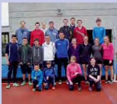
Altendorfer Aktivriegler und J+S-Riegler beim gemeinsamen Trainingsweekend.