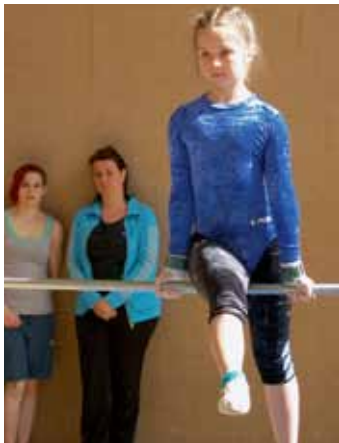
Anmutige Reckvorführung an der Geräteturn-Einzelmeisterschaft in Leukerbad.

Am 20. April fanden in Leukerbad die Einzelmeisterschaften im Geräteturnen von Polysport Wallis statt. Rund 60 Kinder aus verschiedenen Sektionen haben dabei um die Medaillen gekämpft. Auch diejenigen, welche keinen Podestplatz ergatterten konnten, durften einen sportlichen Trostpreis entgegennehmen. Der Organisator SVKT Leukerbad bedankt sich bei allen Teilnehmern, aber auch bei allen Helfern, der Gemeinde Leukerbad sowie der Sportarena für die Bereitstellung der Infrastruktur. Nach einem gelungenen und vor allem unfallfreien Tag durften alle Teilnehmenden zufrieden nach Hause reisen.