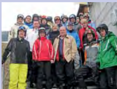
KTV Altendorf beim Skiweekend in Andiast/Brigels.

Fortsetzung von Seite 11 >> Zug brachten die Schülerinnen U16 den guten 16. Rang von insgesamt 24 Teams nach Hause und auch die Jugend U18E-Equipe männlich sammelte auf dem 9. Rang wertvolle Erfahrung. Auch wenn das Potential altersbedingt noch nicht ganz ausgeschöpft werden konnte, war dies für alle Beteiligten ein gelungener Anlass und kann als guter Start für die Saison 2013 gewertet werden. Die Technik in Sprint, Wurf- und Sprungdisziplinen zu verbessern, war dann am 20./21. April das Ziel des gemeinsamen Trainingsweekends der Aktiven und J+S-Riegler. Über 20, je hälftig aus beiden Riegen, nahmen daran teil. Die Aktivriege startet mit der LMM am 9. Mai in die Wettkampfsaison, gefolgt am 25. Mai von den Kantonalen Vereinsmeisterschaften in Einsiedeln. Saisonhöhepunkt ist das Sportfest 2013 in Niederbüren.