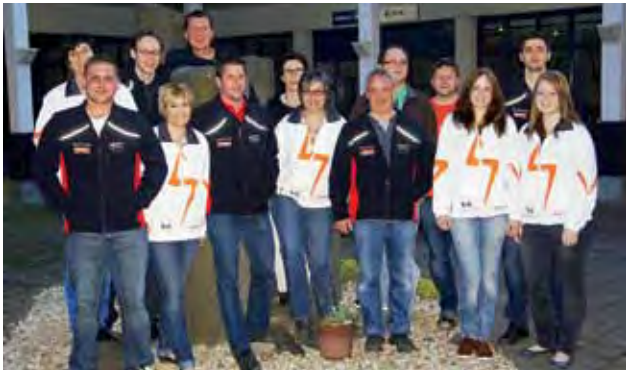
Gemeinsam im Einsatz für die Jugend: Das OK von SVKT und KTV Widnau.