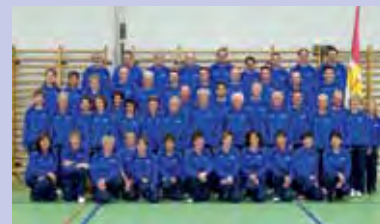
Das KTV-Einsiedeln-Blau wird auch dieses Jahr an verschiedensten Wettkämpfen zu sehen sein.