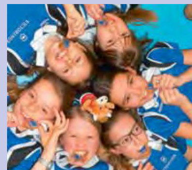
TV Ibach U12 Girls mit Edelmetall vom UBS Kids Cup Team- Final 2013.

TV Ibach: Am Schweizer Final des UBS Kids Cup Team in Willisau setzten die Ibachler U12-Girls die Serie fort, die sie am Lokal- und Regionalfinal begonnen hatten: Sieg im Schweizer Final! Die Belohnung ist ein Startplatz im Vorprogramm von Weltklasse Zürich von Ende August. Die Vorfreude ist jetzt schon riesengrosse und es ist gar keine Frage, ob «girl» dort an den Start will.