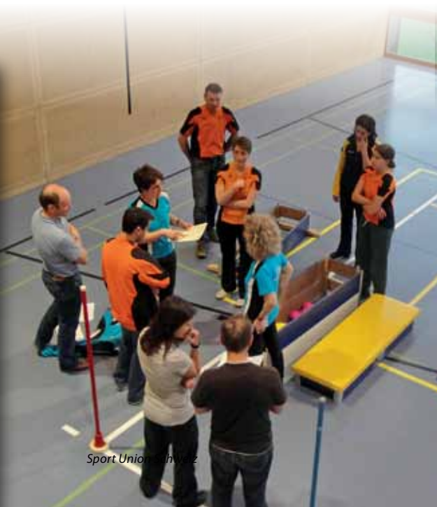
Sport Union Schweiz