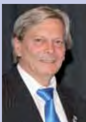
Jürg Küffer Zentralpräsident Sport Union Schweiz

«Wo ein Wille ist, ist auch ein Weg». Im Sport sind dank dieser geflügelten Worte schon viele grosse Ziele erreicht worden. Das 20. Schweizer Sportfest 2012 in Gossau-Fürstenland ist der beste Beweis dafür!