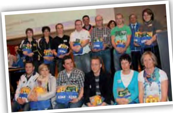
Vertreter der geehrten Mannschaften.