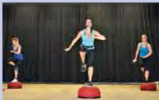
Effizientes Training auf dem Togu-Jumper beim Aerobic-Marathon in Hildisrieden.

Aerobic-Marathon Sport Union Hildisrieden: Am 23. März führte die Sport Union Hildisrieden schon zum 7. Mal den Aerobic-Marathon durch. Von 17 bis 21 Uhr wurde in der Inpulschalle zu mitreissender Musik bei Aerobic, Step- und Dance-Aerobic, Zumba und einer Lektion mit dem neuen Togu-Jumper geschwitzt. Was ist der Togu-Jumper? Springend und voller Spass lässt sich mit ihm Koordination, Balance, Kraftausdauer, Schnellkraft, Bein- und Armmuskulatur sowie Schulter- und Rumpfpattie trainieren.