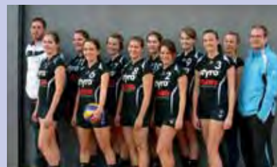
Das Aufsteigerteam des TSV Steinen.