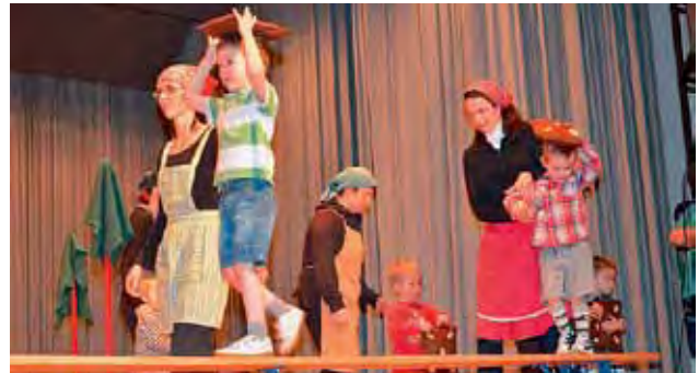
Früh übt sich, was ein erfolgreicher «Jugiler» werden will.