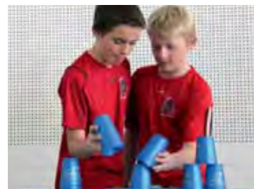
Die geehrten «Concordianer» bedanken sich mit einer Becherstapel-Show.