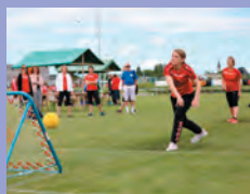
Projektgruppe 35+ Erarbeitung neuer Teamwettkampf 35+