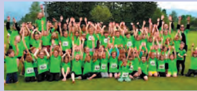
TSV Häggenschwil Projekt Jugimix