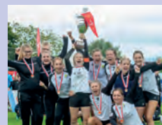
SUS-Team des Jahres SVD Diepoldsau-Schmitter Faustball Frauen Schweizermeisterinnen 2020