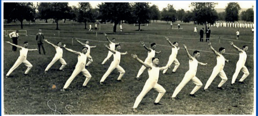
Turnfest 1933 in Zug

An der Hauptversammlung im Jahr 1964 wurde beschlossen, dass Turner, die weniger als sechs Turn- und Trainingsstunden besuchten, aus dem Verein ausgeschlossen werden. Dies ist aber heute nicht mehr der Fall.